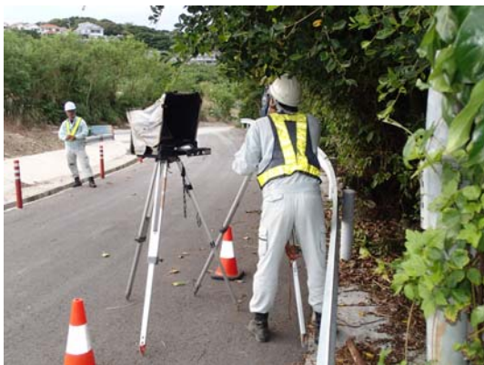
電子平板測量状況