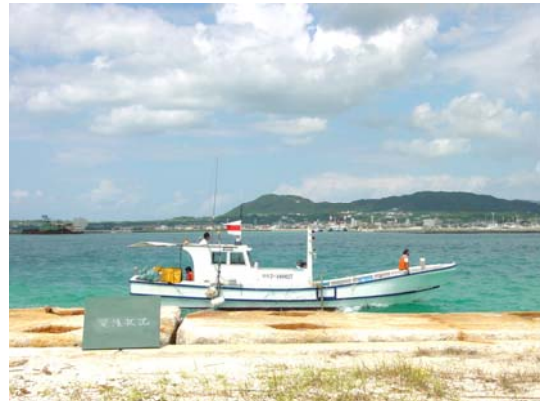
D-GPS 誘導による深淺測量状況